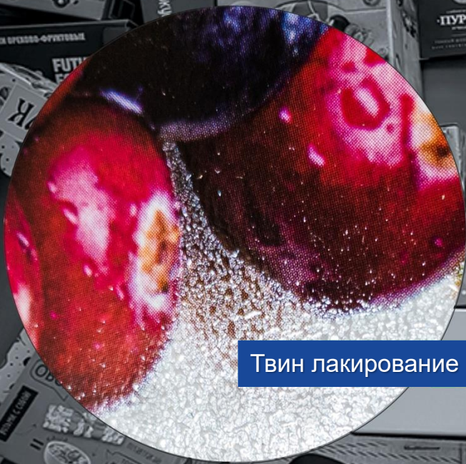
Твин лакирование Drip-off