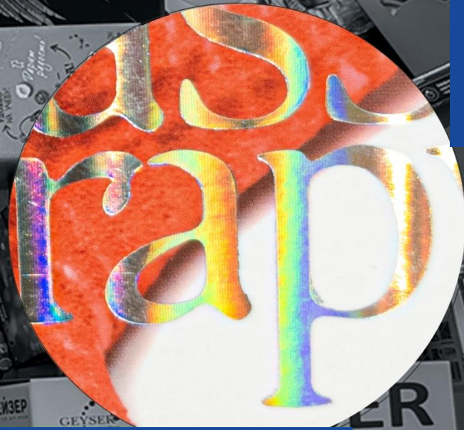
Тиснение голографической фольгой